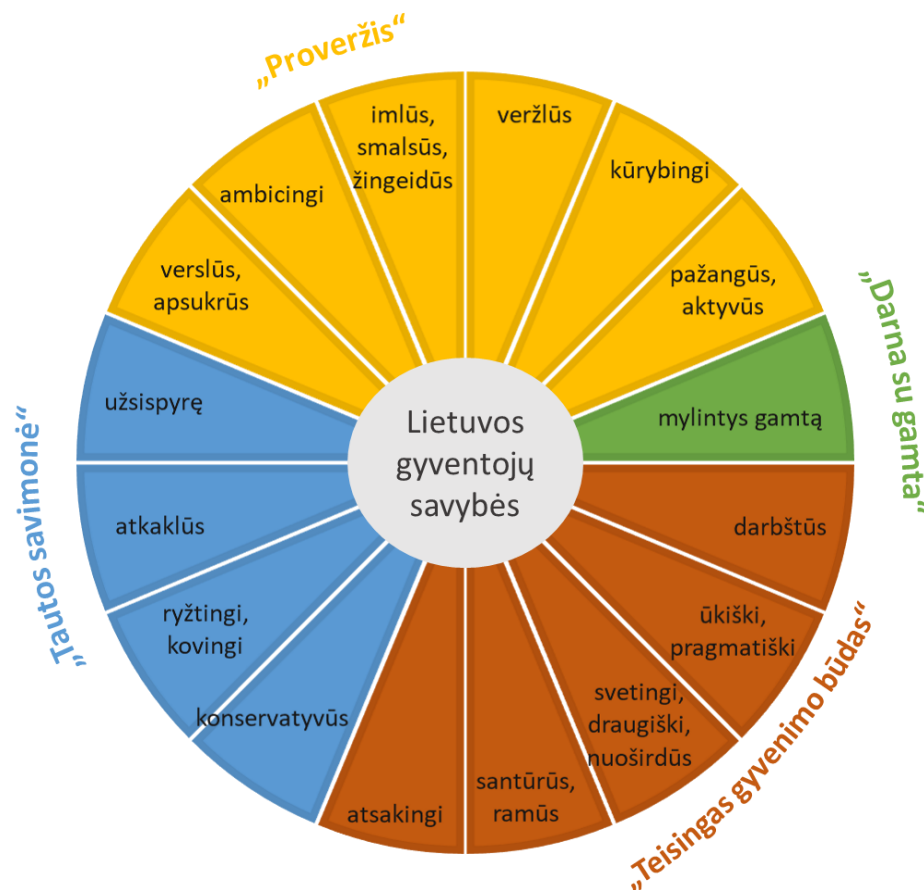
2 pav. Lietuvos gyventojų savybės pagal vertybių grupes

Kai kurios savybės gali būti siejamos ir su išskirtomis vertybių grupėmis, nors galima pastebėti, kad tos pačios savybės kartais gali būti siejamos su keliomis vertybių grupėmis. Jos pateikiamos 2 paveiksle. Vis dėlto tenka atkreipti dėmesį, kad dalis ekspertų aptartų savybių (svetingi, kuklūs, santūrūs, uždari, jautrūs, emocingi, savikritiški, pavydūs, stačiokiški) sunkiai gali būti priskirtos prie išgrynintų vertybių grupių ir lieka nesusietos su vertybėmis. Tad reikėtų vertybių ir savybių sąsajų tolimesnio išvystymo šalies pozicionavimo kontekste.